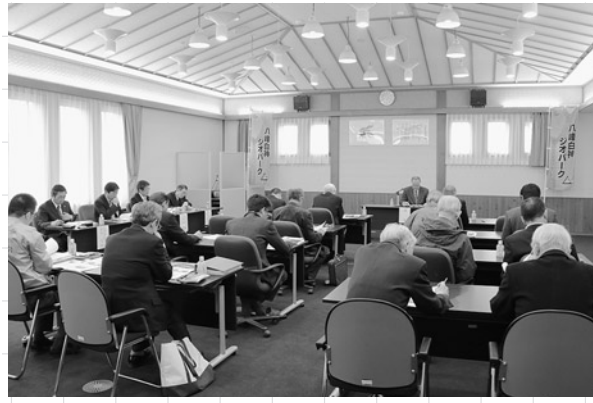
平成28年度総会の様子

こんにちは。八峰白神ジオパーク推進協議会事務局です。先日、平成28年度八峰白神ジオパーク推進協議会の総会が開かれ、今年度の事業案、予算案についてご承認を頂きました。