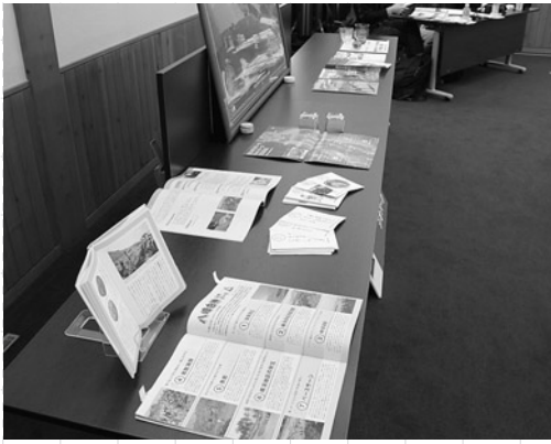
総会ではジオパーク関連資料も紹介しました