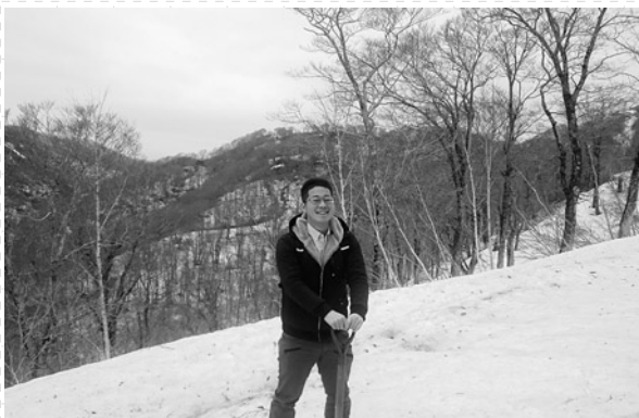
残雪の二ツ森登山口へ

ぶなっころんどでは随時さまざまなイベントを行っていく予定です。皆さんお暇があればぜひ遊びに来てください。