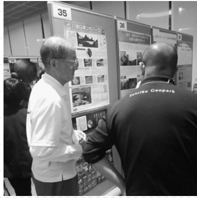
ポスター発表の様子

11月9日〜12日に日本ジオパーク伊豆半島全国大会が、静岡県沼津市を主会場に開催されました。「連携が生み出す未来」をテーマに、分科会やポスター展、講演会、伊豆半島の自然を楽しむツアーが催されました。大会には八峰白神ジオパークからも4名が参加し、ポスター発表などを行いました。