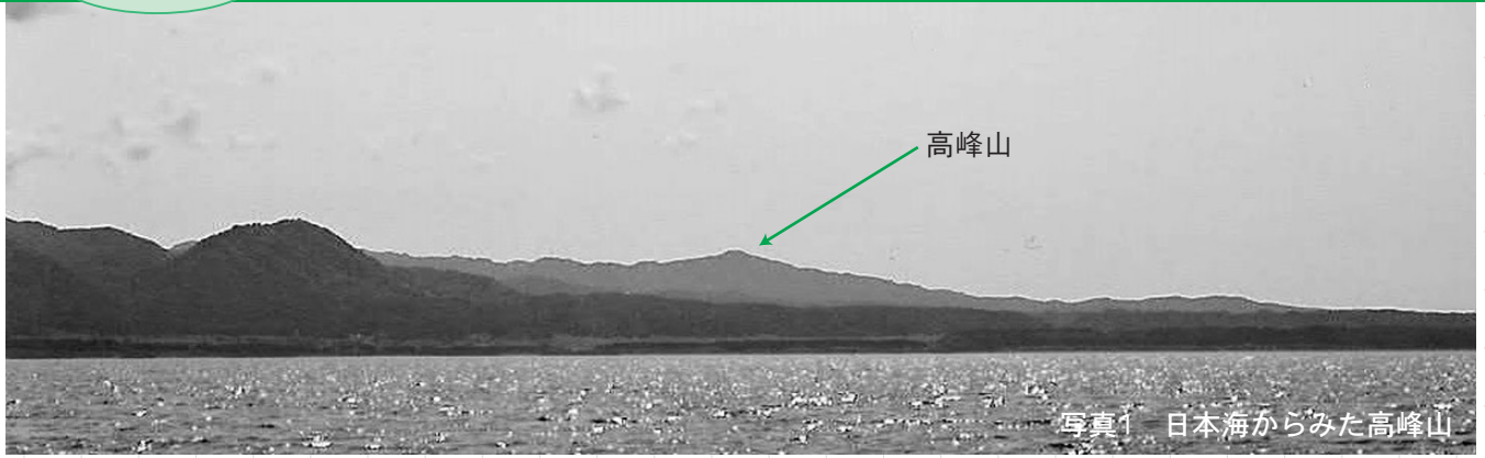
写真1 日本海からみた高峰山