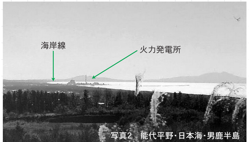
写真2 能代平野・日本海・男鹿半島

日本海に突き出た男鹿半島、その手前に形成された内湾状の海岸線(写真2矢印)、その最も奥まった場所に能代火力発電所がみられます。さらに内陸部は能代平野が形作られています。今から12万6千年前は海でした。もし、