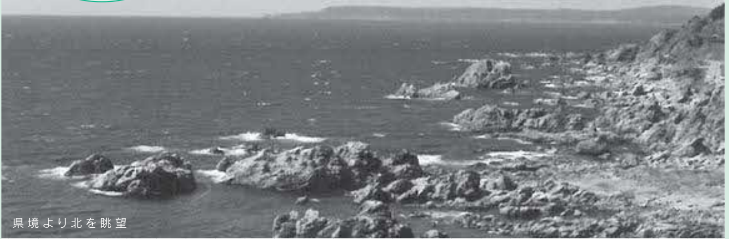
県境より北を眺望