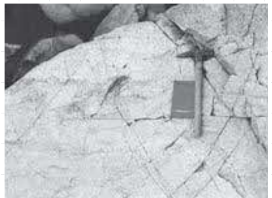
カコウ岩類に見られる模様 固い岩石も9千万年前は流れ「おかげ」みただった。どう流れていたかな？